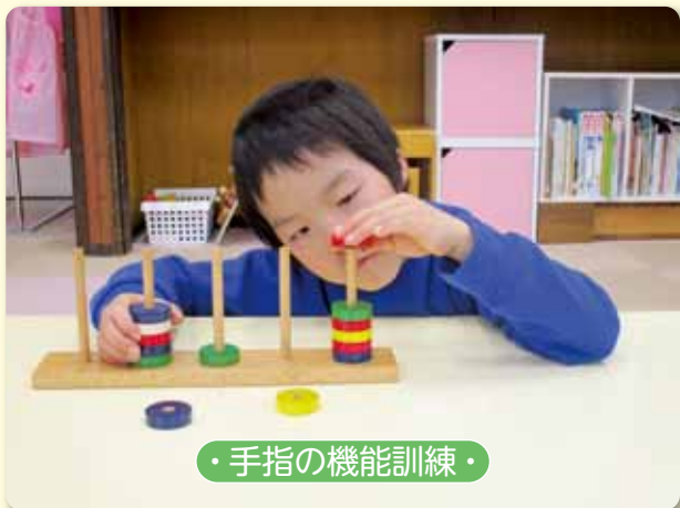
・手指の機能訓練・

家庭や学校以外の居場所づくりとしてご利用ください。広いスペースでのびのびと、運動や音楽、創作など自由に楽しんでいただけます。まずは、気楽に見学からどうぞ。