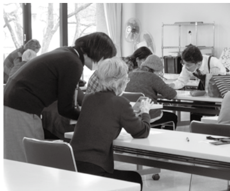
スマホサポーターあそびなぐる 受講生の方が優しく教えています。

内容 認知症や障がいなどにより、判断能力が十分でなくなっても「住み慣れた地域でいつまでも安心して暮らしたい」という思いに寄り添えるよう、支援の仕組みについて学び、あんしんサポート支援員として活動してみませんか。