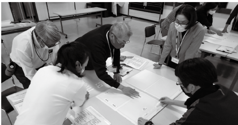
災害ボランティアセンター サポーターゼミナ〜る