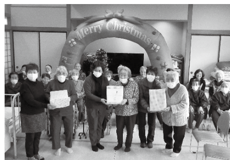
▲あいづ商工会女性部様