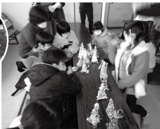
あいづっこぜみな〜る わくわく♡物づくり 光るクリスマスツリー作り