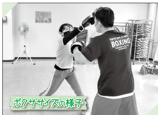
ボクササイズの様子