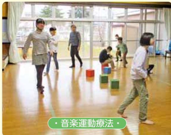
・音楽運動療法・