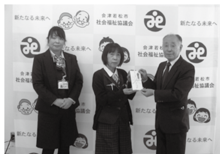
▲会津ヤクルト販売株式会社様