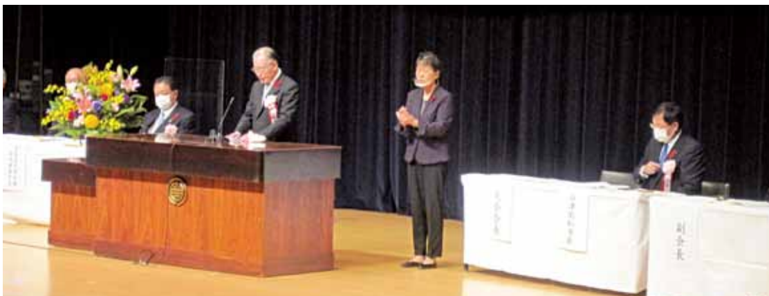
大会会長のあいさつ

ラブ国際協会3321D地区第4R第1Z グローバルアドバンストメタルジャパン株式会社会津工場 会津若松市老人クラブ連合 会河東地区協議会