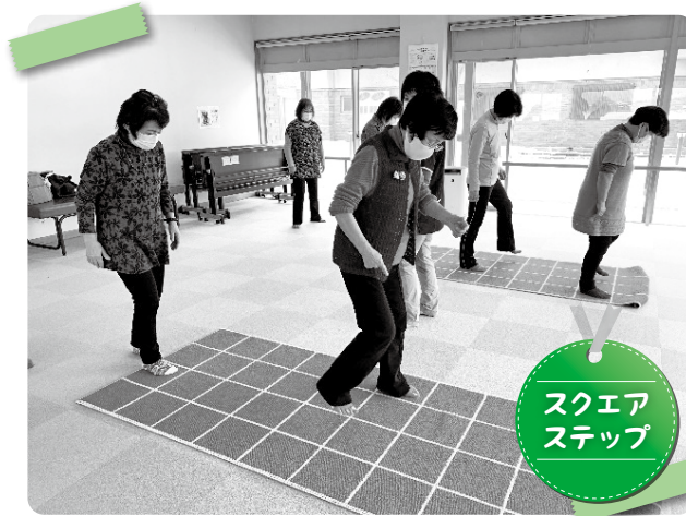
スクエア ステップ