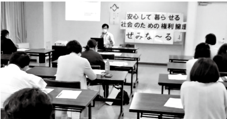
安心して暮らせる社会のための権利擁護せみな〜る 「障がいについて」

今後も新型コロナウイルス感染症に留意しながら活動いたします。次年度の募集は、社協だより2月号に掲載致します。