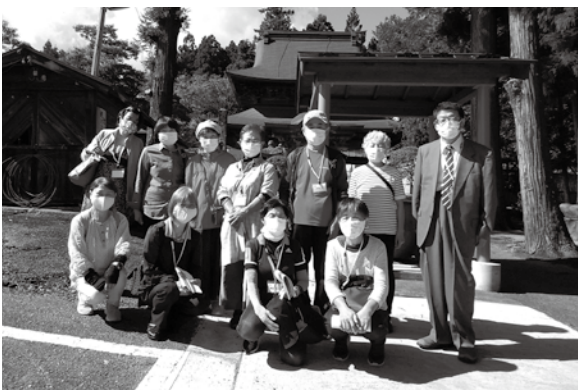
サロンサポーターせみな〜る「地域サロンお出かけプラン活用体験」 〜三十三観音参りで北会津3ヶ所と新鶴中田観音へ行ってきました〜