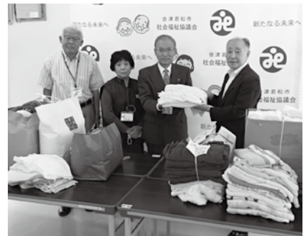
城北地区民生児童委員協議会様