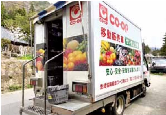
地域へ移動販売車の誘致

今後も、地域住民の方々が「いつまでも大戸地区で暮らし続けたい」と思える地域づくりのため、支え合いを基盤とした活動を続けていきます。