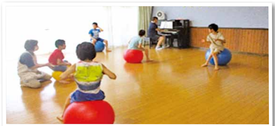
放課後等デイサービスの音楽運動療法の様子