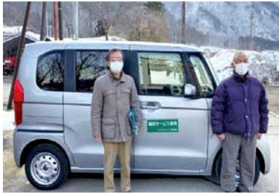
交通弱者への移動支援実証実験