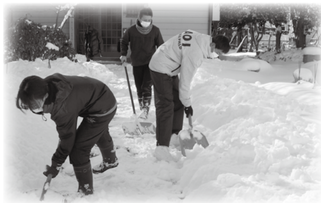
昨年のボランティアの様子 ～ 高校生の皆さん大活躍でした!!