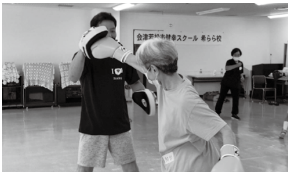
希らら校ボクシングに挑戦!!

ご興味のある方は、各問合せ先までお電話ください。資料が出来次第、郵送させていただきます。