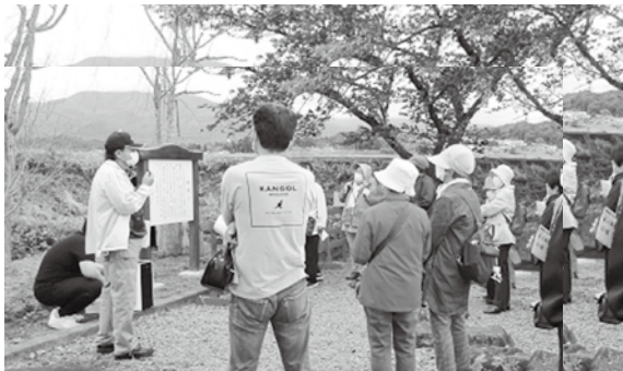
社会活動の講座(藤倉地区歴史探訪)