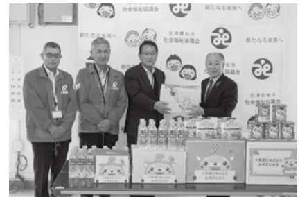
▲大東建託株式会社様