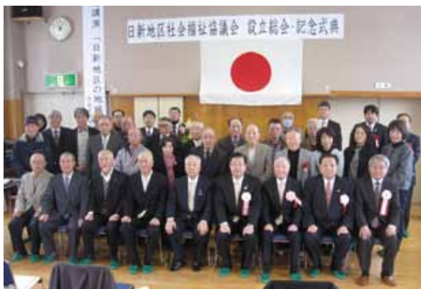
※撮影時のみマスクを外しています。