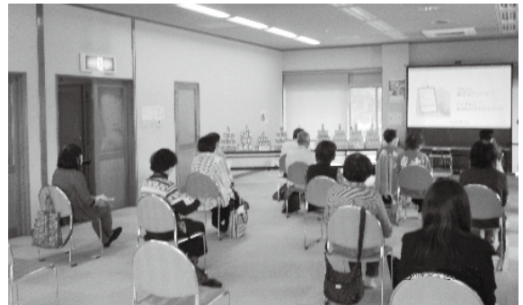
カゴメ株式会社による講義&ベジチェック(野菜摂取量測定)