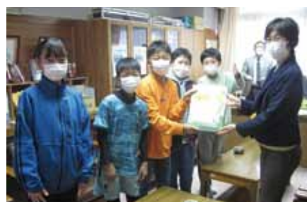
松長小学校の皆さんより