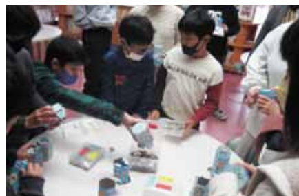
日新小学校募金活動の様子

昨年度の赤い羽根共同募金より、助成を受けた市内施設からのメッセージをご紹介します。