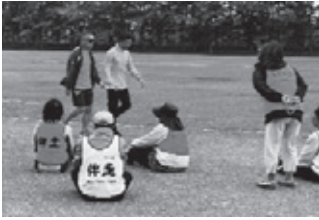
伴歩ボランティアの様子