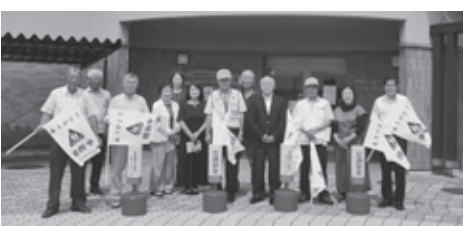
道路を渡るときは左右をよく確認しましょう！

北会津ふれあいネットワークでは、子どもたちの安心安全のための活動など、地域の福祉向上に繋がる活動を今後も続けていきます。