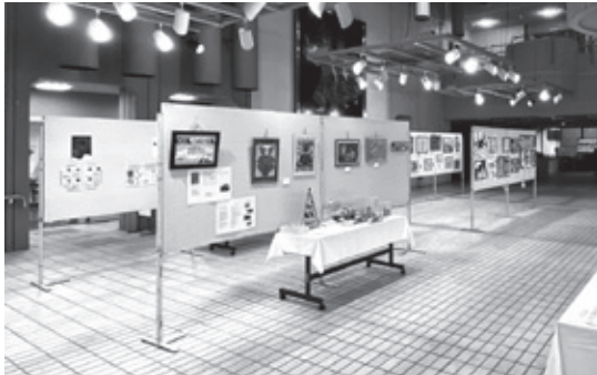
※個人の方の作品を募集しております。