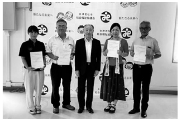
ふれあいのまちづくり地域福祉活動助成事業 助成金決定書交付式

また、除雪ボランティアや障がい者ボランティアなど、それぞれに設けていたボランティアポイント制度を一本化（ありがとね☺ボランティアポイント）し、利用者に分かりやすい制度に改めました。