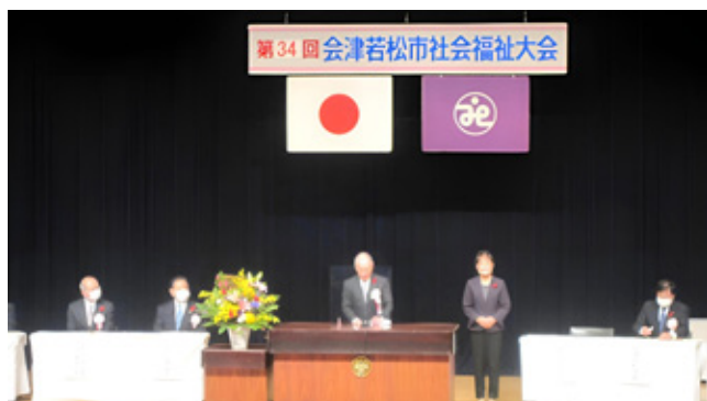
令和3年度 第34回社会福祉大会の様子