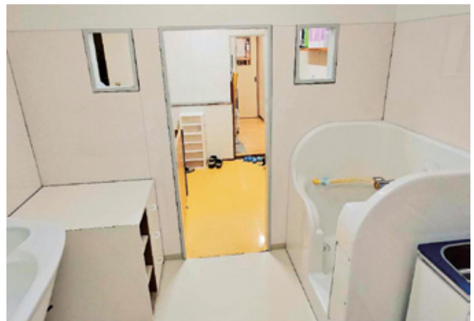
修繕した沐浴室の様子