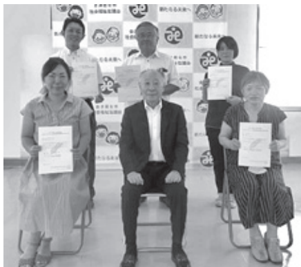
～助成金交付決定団体の皆様～

本助成金は、令和4年度共同募金運動で皆様からお寄せいただいた募金を活用して「地域におけるネットワークの促進」を目的に募集したもので、社会福祉法人、地域ボランティアグループ、特定非営利活動法人（NPO）等を対象として、以下の5団体に助成金を交付しました。