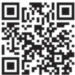
ボランティアの登録はこちら

会津の冬だからこそできるボランティア活動を楽しみながら行ってみませんか？下記の申込先までご連絡ください。