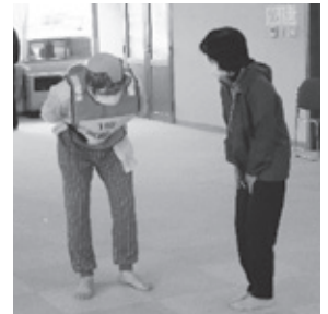
高齢者に声をかける様子

北会津ふれあいネットワークでは、今回の訓練を通して、北会津地区内の誰もが安心して暮らせる地域づくりを今後も進めてまいります。