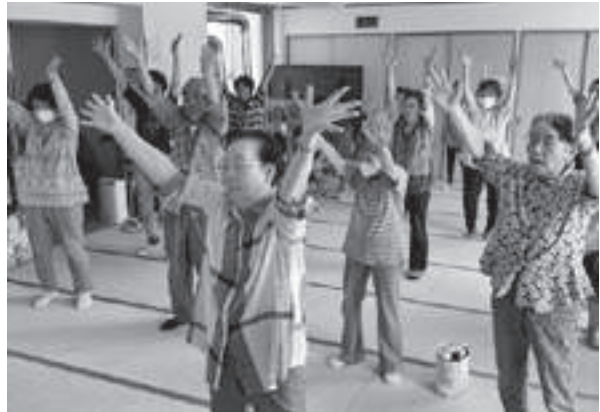
唱歌に合わせた体操「エンカサイズ」