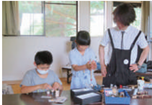
「あいづっこゼミな〜る」 わくわく♡ものづくり