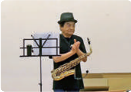
懐かしのメロディーを届ける 「楽団ひとり」