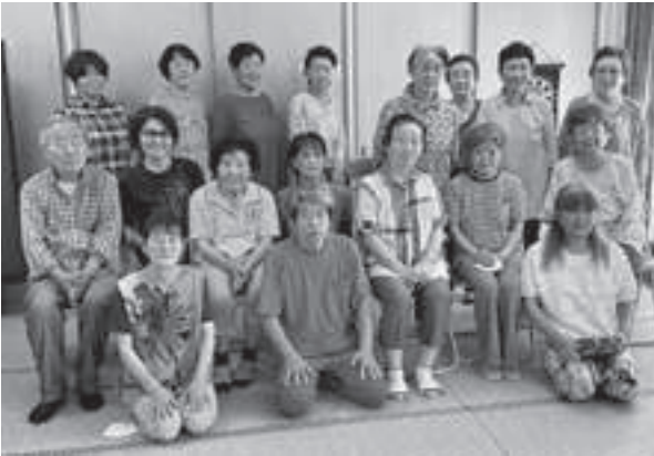
1周年を記念した集合写真