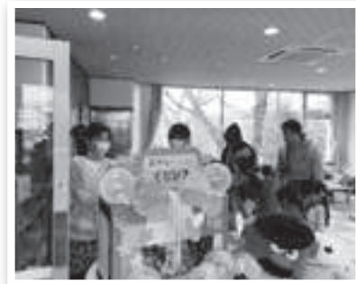
▲昨年度の助成金事業による活動

今年度も10月より、赤い羽根共同募金及び歳末たすけあい募金運動がはじまります!! ご協力の程よろしくお願いたします。