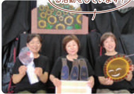
影絵で楽しませる 「素敵な3人ぐみ」影絵芝居団体