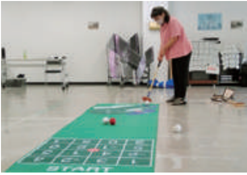
「地域活動サポーターゼミな〜る」 レクリエーションゲームを楽しもう①