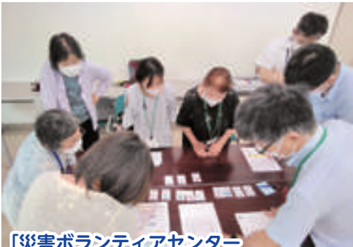
「災害ボランティアセンター サポーターゼミな〜る」 災害ボランティアセンターの活動を学ぶ