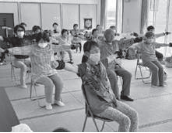
重りを付けて百歳体操をする参加者